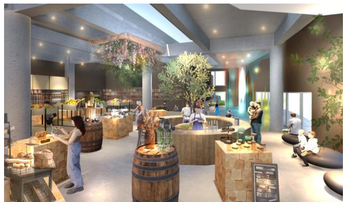
「地球といきる」を感じる物販エリア（イメージ）