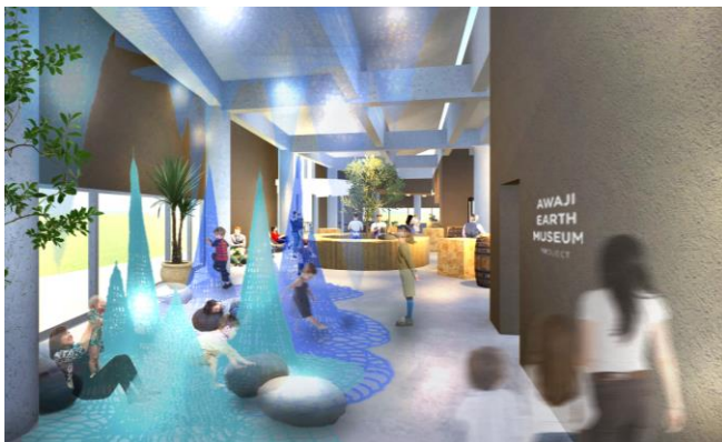
子供が学びながら楽しめる施設（イメージ）

このプロジェクトでは、地域の行政や住民の皆様と連携し、独自のサステナブルツーリズムを体現した空間の実現を目指しています。また、淡路島への誘客に貢献している既存の高速バス路線を最大限に活用し、野島断層を起点としながら環境教育やレジャー体験を楽しめる場所づくりを中核に新たな誘客を生み出す施設になります。併せて、野島断層保存館の団体見学のお客様に対して本施設への立ち寄りの促進、また関西圏の日帰りファミリー層のお客様へ体験価値を高めるプログラムを提供し、当社のネットワークを活用したプロモーションを行うことで、多くのお客様の来場を目指しております。